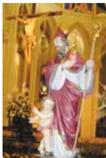
Imagen de San Agustín en la Eucaristía de Madrid

El viernes día 19 de Noviembre de 2005 los alumnos de E.S.O. vieron un video sobre San Agustín de Hipona y los alumnos de 3º, 4º, 5º y 6º un montaje en diapositivas sobre su vida. A continuación salimos casi todo el colegio del recinto para dirigirnos hacia la Parroquia de Santa Clara, allí rendimos un Homenaje a San Agustín con motivo de su 1650 aniversario de su nacimiento; nos lo pasamos muy bien porque cantamos, algunos leímos, y rezamos. En los bancos de la parroquia había algunas unas oraciones de San Agustín que comentamos y leímos allí.