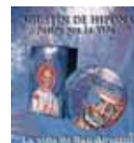
Video sobre San Agustín