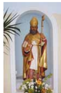
Imagen de San Agustín venerada en la Parroquia Santa Clara.

En esas fechas algunos Agustinos de la Comunidad de Sevilla participaron en la Catedral de la Almudena de Madrid en la Solemne Eucaristía de Acción de Gracias que celebró toda la Familia Agustiniana en España (FAE). Nos ha parecido una buena idea porque con este acontecimiento aprendimos más sobre su interesante vida.